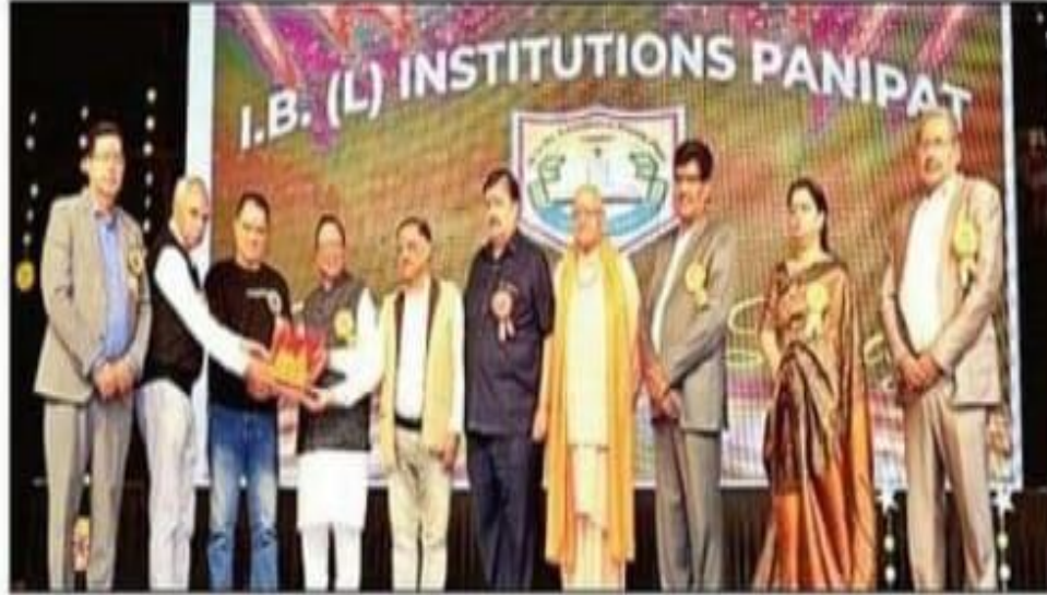
आईबीएल स्कूल में आयोजित समारोह में अतिथियों को सम्मानित करते पदाधिकारी। संस्थान