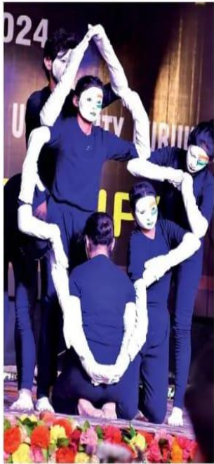
पानीपत. माहप प्रतिरोधिता में भारत विषय पर नाट्य के दौरान तिरंगा बनकर छात्राएं कार्यक्रम में प्रस्तुति देते हुए।