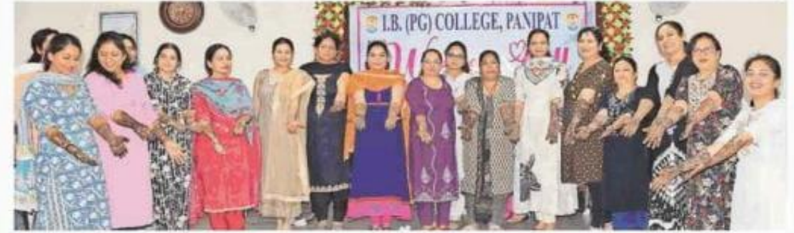
मेहंदी दिखाती छात्राएं एवं शिक्षिकाएं।