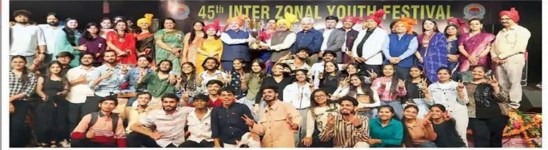
पानीपत, आईबी पीजी कॉलेज में आयोजित 45वें इंटर जोनल युवा महोत्सव में विजेता ट्रॉफी के साथ जश्न मनाते हुए।

आईबी पीजी कॉलेज में 45वें इंटर जोनल युवा महोत्सव का समापन