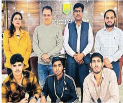
अपने पदक के साथ खिलाड़ी ।