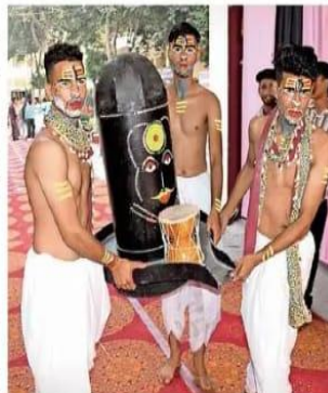
पानीपत. आईबी कॉलेज में शिवांगिण लेकर प्रस्तुति देने के लिए जाते छात्र।