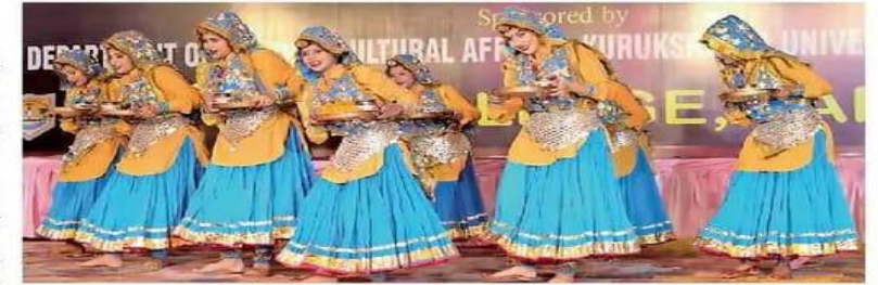
आईबी पीजी कॉलेज में आयोजित 45वें इंटर जोनल युवा महोत्सव में प्रस्तुति देती छात्राएं।