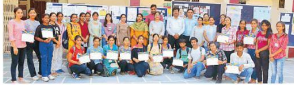
प्रतियोगिताओं के विजेता प्रतिभागी

पानीपत, 11 अक्टूबर (खबरे) : आई.बी. महाविद्यालय के गणित विभाग द्वारा आयोजित पोस्टर मेकिंग, कोलाज क्राफ्टिंग और स्लोगन लेखन प्रतियोगिताओं में महाविद्यालय की सभी कक्षाओं के विद्यार्थियों ने बहु-चतुर भाग लेकर गणित के विभिन्न विषयों जैसे समरूपता, फिबोनेक सीरीज, त्रिकोणमिति, दैनिक जीवन में गणित की भूमिका आदि पर पोस्टर कोलाज एवं स्लोगन बनाए गए।