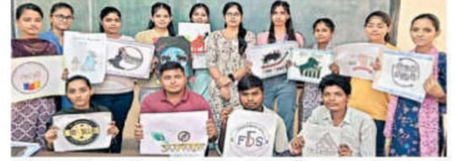
लोगो डिजाइनिंग प्रतियोगिता में भाग लेने वाले विद्यार्थी।