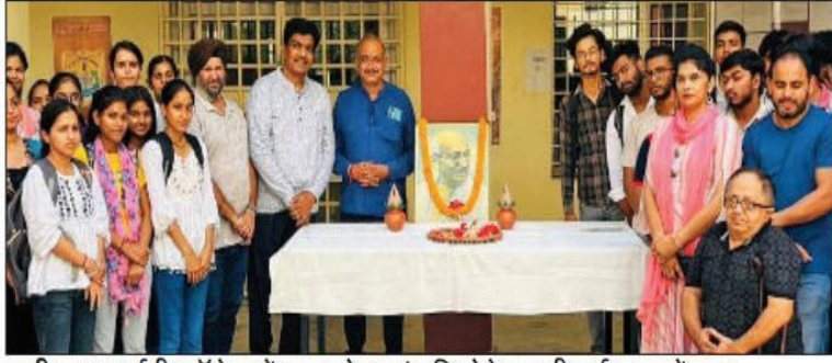
पानीपत। आईबी कॉलेज में बापू को श्रद्धांजलि देते हुए टीचर्स व स्टूडेंट्स।