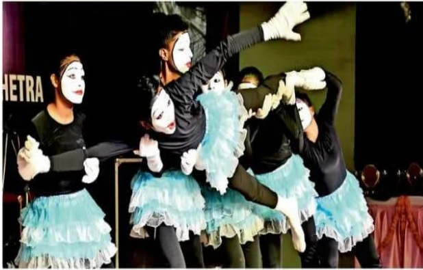
पानीपत. आईबी कॉलेज में इंटर जोनल यूथ फेस्टिवल में अग्रणी सांस्कृतिक कार्यक्रम में प्रस्तुति देती छात्राएं

45वां इंटर जोनल यूथ फेस्टिवल कोरियोग्राफी और हरियाणवी ग्रुप सांग में एसडी कॉलेज पानीपत प्रथम और रंगोली में आर्य कन्या कॉलेज शहाबाद रहा अव्वल