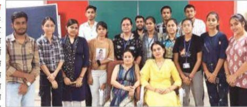
नाटक में भाग लेने वाले विद्यार्थी।