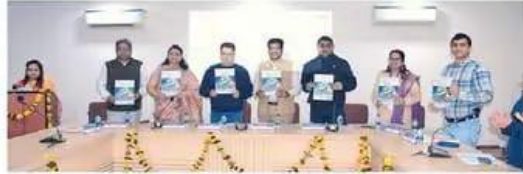
आईबी पीजी कॉलेज में कॉन्फ्रेंस में मौजूद विषय विशेषज्ञ।