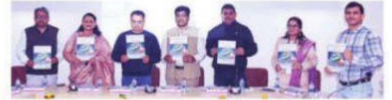
आईबी कालेज में उच्च शिक्षा विभाग ने राष्ट्रीय स्तर पर कांफ्रेंस का ब्लेंडेड मोड में उपस्थित अतिथिगण। (मोहन लाल)

आईबी कालेज में उच्च शिक्षा विभाग ने राष्ट्रीय स्तर पर कांफ्रेंस का ब्लेंडेड मोड में किया आयोजन