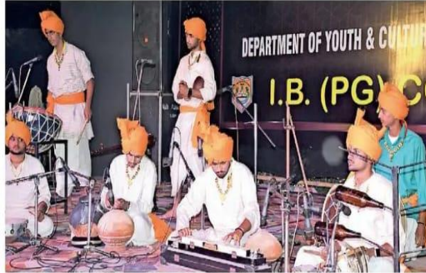
पानीपत. आईबी कॉलेज में इंटर जोनल यूथ फेस्टिवल में हरियाणवी आरकेस्ट्रा में प्रस्तुति देते छात्र।