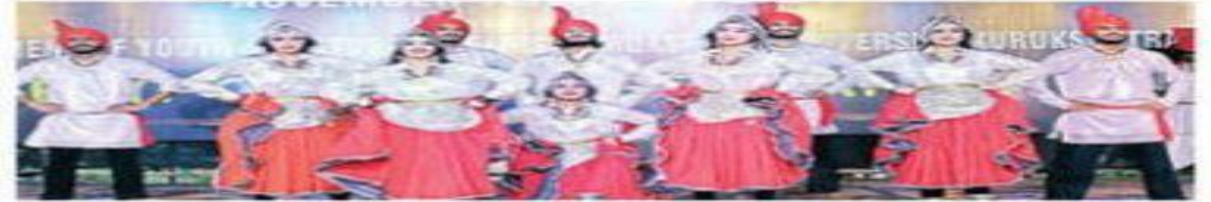
महोत्सव में प्रस्तुति देते विद्यार्थी ।