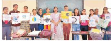
प्रतियोगिता के विजेता प्रतिभागी।

कहा कि विद्यार्थी इस तरह की प्रतियोगिताओं में भाग लेकर अपने निश्चित विचार, तथ्य या प्रक्रिया पर ध्यान केंद्रित कर पाते हैं। उन्होंने विद्यार्थियों को बताया कि वे किस प्रकार से गणित का अनुप्रयोग करके न केवल अनुपात और समरूपता को देख सकते हैं बल्कि प्रत्येक विवरण