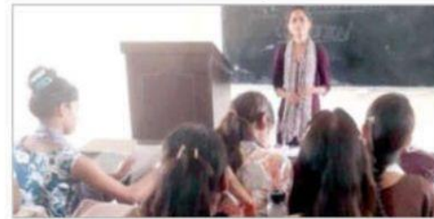
विद्यार्थियों को जानकारी देते हुए वक्ता।