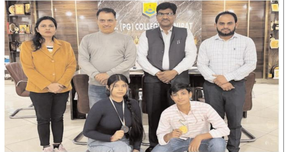
आज समाज नेटवर्क