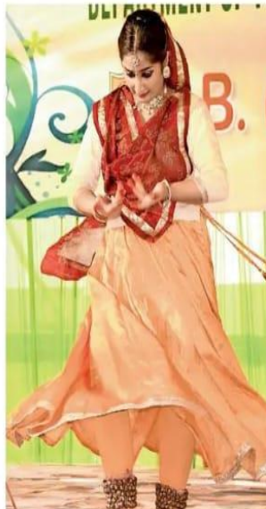
पानीपत. आईबी कॉलेज में इंटर जोनल यूथ फेस्टिवल में डांस करती छात्रा।