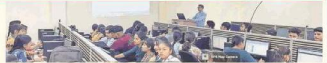
स्किल कोर्स में भाग लेते विद्यार्थी।