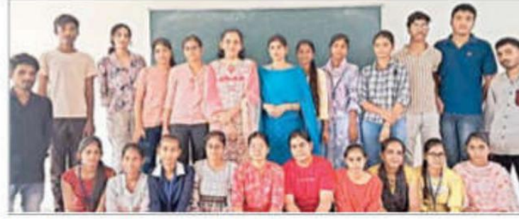
डेक्लामेशन प्रतियोगिता में भाग लेने वाले विद्यार्थी।