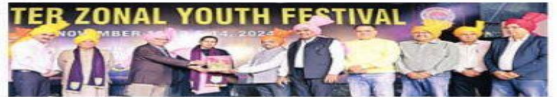
मेहमानों का स्वागत करते आयोजक ।