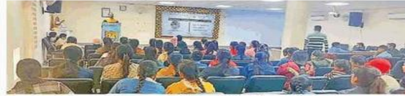
वार्ता में हिस्सा लेते विद्यार्थी।

पानीपत, 3 फरवरी (खुशबु) : जी.टी. रोड स्थित आई.बी. स्नातकोत्तर महाविद्यालय में प्लेसमेंट एंड करियर गाइडेंस सैल एवं मेधा फाउंडेशन के संयुक्त तत्वावधान में एन एक्सपर्ट टॉक जिसका विषय 'हाइ इम्पैक्ट टेक्नोलॉजीज आर शॉपिंग द फ्यूचर ऑफ आई.टी.' का आयोजन किया गया। इसमें 100 से भी अधिक विद्यार्थियों ने बड़-चढ़कर भाग लिया। इस वार्ता का मुख्य उद्देश्य विद्यार्थियों को यह बताना था कि किस तरह से वे आई.टी. में अपना भविष्य बना सकते हैं। आई.टी. क्षेत्र वह होता है, जिसमें किसी कंपनी/उद्योग, व्यापार, बिजनेस के अंदर कंप्यूटर व टेक्नोलॉजी से संबंधित कार्य किए जाते हैं। इस