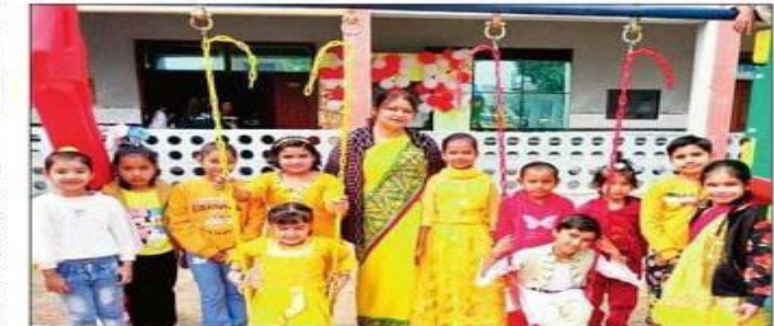
वसंत ऋतु का स्वागत करते बच्चे। संस्थान

पानीपत। आर्य गर्ल्स पब्लिक स्कूल की जूनियर विंग की छात्राओं ने येलो डे मनाकर वसंत ऋतु का स्वागत किया। कक्षा नर्सरी से द्वितीय की छात्राएं पीले रंग की आकर्षक वेशभूषा में विद्यालय पहुंचीं। उन्हें पीले रंग का महत्व व वसंत काल में प्रकृति में पीले रंग की सौंदर्य छाटा