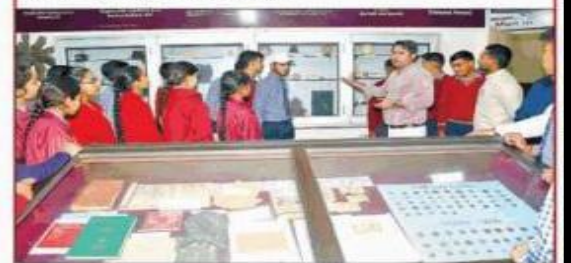
इतिहास संग्रहालय भ्रमण के दौरान जानकारी हासिल करते विद्यार्थी।