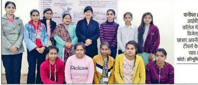
पानीपत। आईबी कॉलेज में विजेता छात्राएं अपनी टीवर्स के साथ।