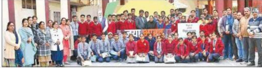
आई.बी. महाविद्यालय में शैक्षणिक भ्रमण के दौरान विद्यार्थी।

पानीपत, 4 फरवरी (खब) : हरियाणा सरकार की एक अद्भुत पहल के तहत, आई.बी. महाविद्यालय में राजकीय मॉडल संस्कृति वरिष्ठ माध्यमिक विद्यालय, राजाखेड़ी (पानीपत) के विद्यार्थी शैक्षणिक भ्रमण के लिए पहुंचे। हरियाणा शिक्षा विभाग की इस पहल को ट्विनिंग प्रोग्राम का नाम दिया गया है। 44 विद्यार्थियों के दल का महाविद्यालय द्वारा गर्मजोशी से स्वागत किया गया।