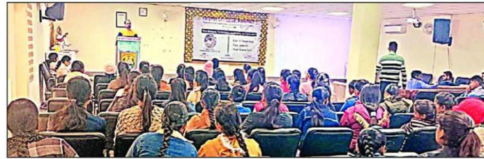
आईबी कॉलेज में आयोजित वार्ता में भाग लेते विद्यार्थी।