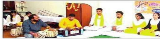
वसंत उत्सव के दौरान प्रस्तुति देने विद्यार्थी। संस्थान