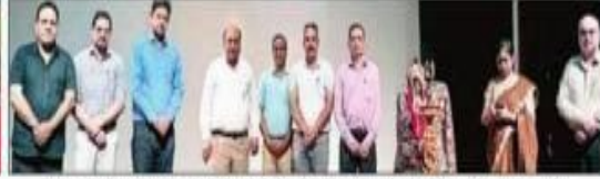
डेटा एनालिटिक्स एंड मैनेजमेंट विषय पर हुई कॉन्फ्रेंस में शामिल रिसर्च स्कॉलर व शिक्षक। संवाद

2021 का आयोजन किया गया। इसमें देश-विदेश के 250 से अधिक रिसर्च स्कॉलर और शिक्षकों ने हिस्सा लिया। इसमें छोटी उम्र में बढ़ते नशे के संबंध में चर्चा करते हुए कारणों की जांच को कहा गया।