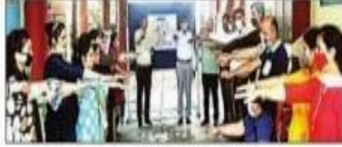
नशा न करने की आईबी कॉलेज में ली गई शपथ। संवाद

समालखा संवाद के अनुसार, पाईट कॉलेज समालखा में कंप्यूटर सॉइस एंड इंजीनियरिंग विभाग के डेटा सॉइस स्वच्छाड क्लब, डॉ.जीन वायजीकोवस्की फुनिर्वासीटी, पोर्लैंड, आईआईएस जयपुर के सहयोग से डेटा एनालिटिक्स एंड मैनेजमेंट विषय पर दूसरी अंतरराष्ट्रीय कॉन्फ्रेंस आईसीडीएम -