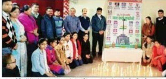
आईबी कॉलेज में 26/11 के हमले में शहीद हुए लोगों को श्रद्धांजलि दी गई।