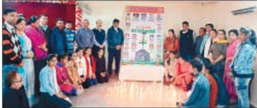
आई.बी. कालेज में हमले की बरसी पर मोमबत्ती जलाकर शहीदों को श्रद्धांजलि देते विद्यार्थी एवं क्लब के स्वयंसेवक।