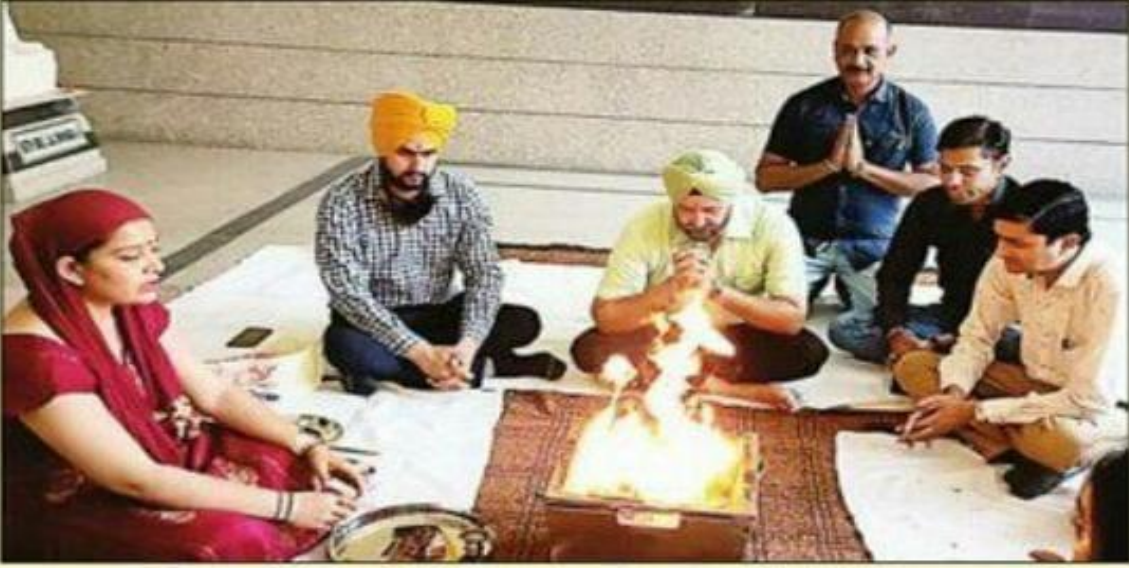
आईबी महाविद्यालय में हुए हवन में शामिल स्कूल स्टाफ। संवाद