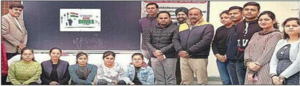
आईबी कॉलेज में आयोजित कार्यक्रम में मौजूद विद्यार्थी व अन्य। संवाद

आई. बी. महाविद्यालय द्वारा मनाये गए महत्वपूर्ण दिवस (सत्र 2021-22)