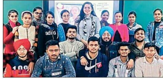
आईबी कालेज के विद्यार्थी कौन बनेगा चैंपियन प्रतियोगिता में भाग लेते हुए। (मोहन लाल)

आईबी कालेज में विद्यार्थियों के लिए कौन बनेगा चैंपियन प्रतियोगिता आयोजित