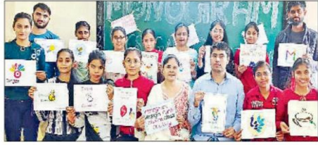
पानीपत। आईबी कॉलेज में प्रतियोगिता के विजेता विद्यार्थियों को सम्मानित करते हुए।