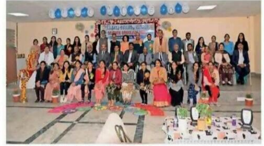
पानीपत. आईबी पीजी कॉलेज में विजेता बच्चों को सम्मानित करते हुए।