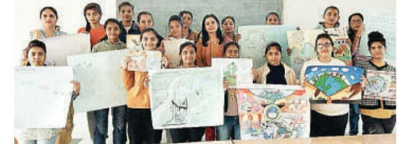
प्रतियोगिता में पोस्टर दिखाते हुए विद्यार्थीगण।