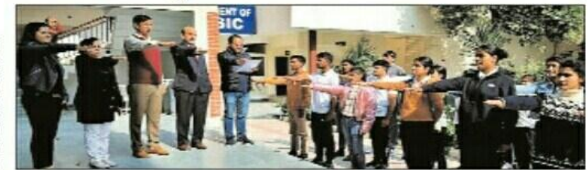
सड़क सुरक्षा नियमों की शपथ लेते विद्यार्थी।