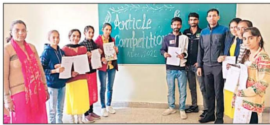
आईबी कॉलेज में विजेता विद्यार्थी प्रसन्न मुद्रा में।

सवेरा न्यूज/ मोहन लाल पानीपत, 12 दिसम्बर : आईबी स्नातकोत्तर विद्यालय में बीए कक्षा के विद्यार्थियों के लिए राजनीतिक विज्ञान विभाग द्वारा आर्टिकल राइटिंग प्रतियोगिता का आयोजन किया गया। जिसका मुख्य विषय अंतरराष्ट्रीय स्तर पर होने वाले युद्ध का प्रभाव को बताना था। प्रतियोगिता में लगभग 40 विद्यार्थियों ने भाग लिया। कार्यक्रम