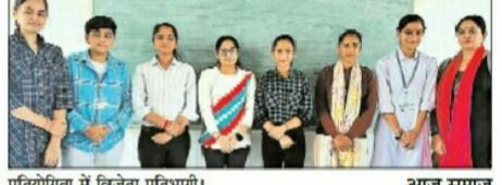
प्रतियोगिता में विजेता प्रतिभागी।