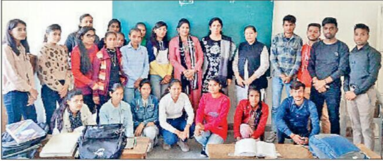
पानीपत। आईबी कॉलेज में विजेता विद्यार्थी प्रसन्न मुद्रा में।