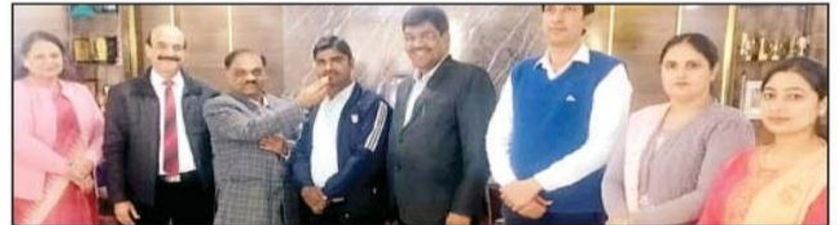
आईबी कालेज में विजेता छात्र-छात्राओं ने कुरुक्षेत्र की मैरिट सूची में आने पर सम्मानित करते हुए। (मोहन लाल)