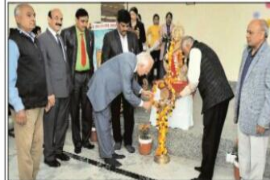
योग प्रवर्धित कर कार्यक्रम का शुभारंभ करते अतिथिगण एवं आयोजक व बच्चों द्वारा बन्दर-गर्-मंडल का अस्कीकरण करते अतिथिगण।