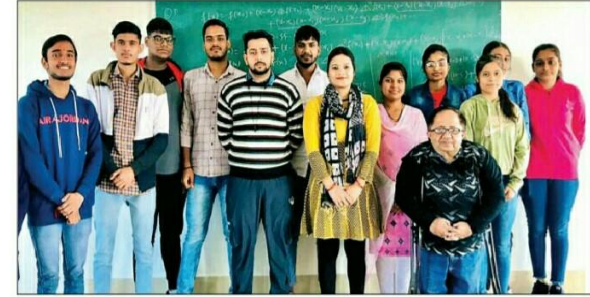
विजेता प्रतिभागियों के साथ स्टाफ सदस्य। आज समाज