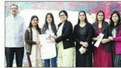
विजेता छात्रों को सम्मानित करते प्रबंधन समिति के लोग।